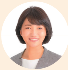
石川智子氏 知立市長