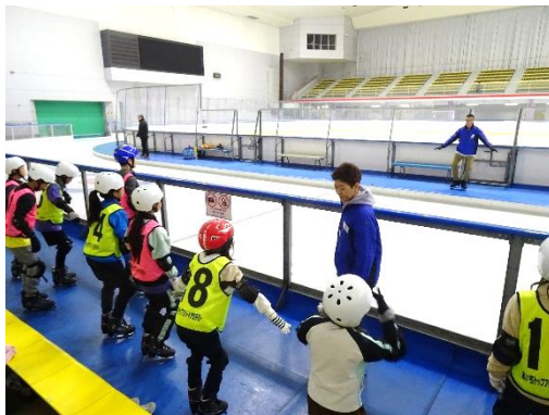
リンクサイドで基本姿勢の確認

活動終了時には、多くのアカデミー生からスケートの楽しさを味わうことができたという声上がり、次回の体験を楽しみにしている様子が伺えました。