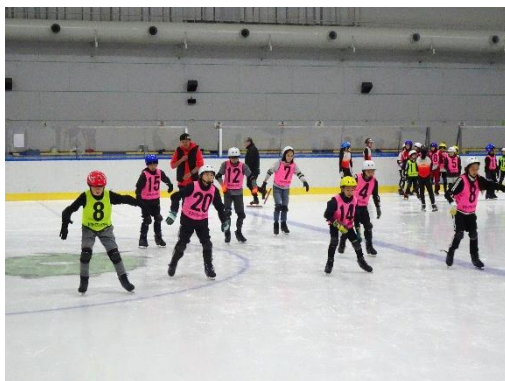
片足に体重を乗せて滑る練習