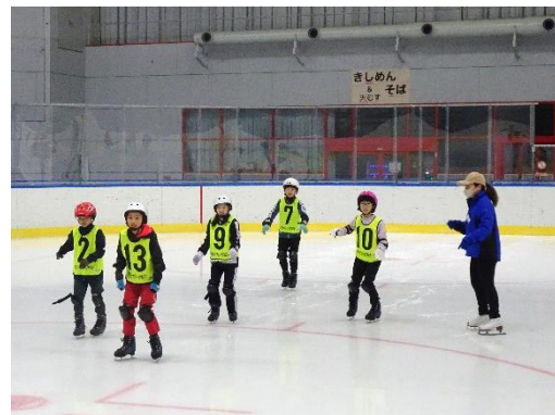
氷上を足踏みで進む練習