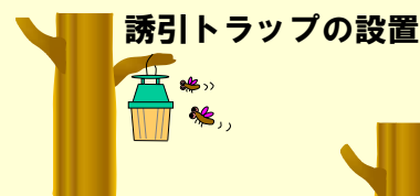
誘引トラップの設置

➡ 誘引トラップの設置、塗布、樹幹注入など、まず散布以外の方法を検討しましょう。