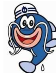
あいち防災キャラクター 防災ナマズン

同封の封筒に入れて、10月24日（金）までに、 郵便ポストにご投函くださるようお願いいたします。 （インターネットでご回答いただいた方は、投函不要です。）