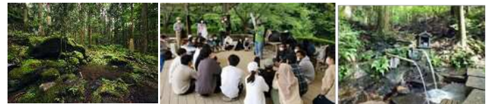
歴史的湧水による町づくり