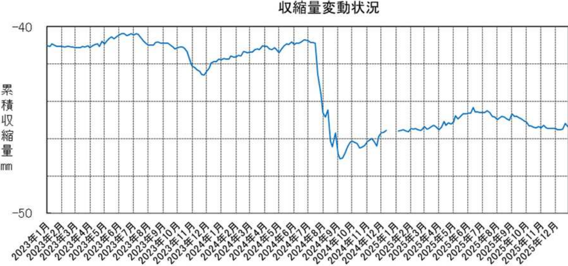
図2 収縮量の変動状況