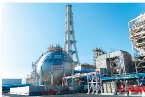
致力于转向氨燃料的JERA碧南火力发电站

为促进碳中和燃料中氢能和氨能等的应用，爱知县推出“爱知氢能相关项目”，开发发电站、工厂、港湾、物流、农业、公共设施等方面对氢能的需求，以增加供给。此外，爱知县还组织了“中部地区氢能氢能社会应用推进会议”，以推动构建氢能氢能供应链，促进对氢能氢能的利用。