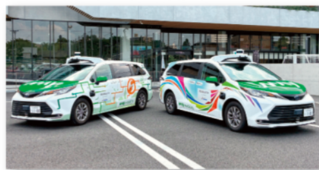
名古屋市内定时运行的自动驾驶车辆

爱知县为提高自动驾驶技术，不仅开展有各种试行实验，还设置了一站式窗口，以方便对应用工作进行支援。