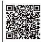
会場図 (各校のブース)