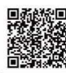
タイムテーブル (大ホール 小ホール)