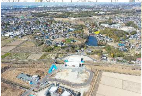
写真◎ 知多3号橋(仮称) 施工状況

西知多道路 ○-001 愛知県道路公社 工事車両には上記のステッカーを貼付しております