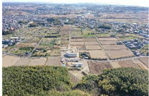
写真◎ 知多2号橋(仮称) 施工状況