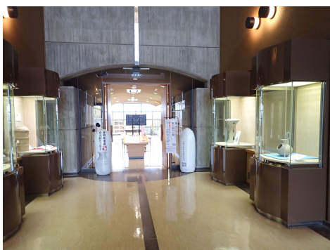
収蔵庫 C 前展示ケース