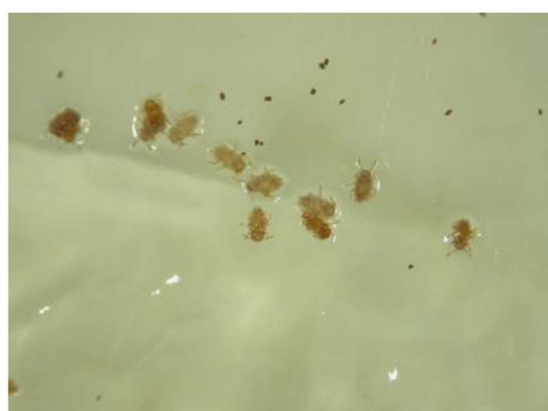
図3 ワセリンに付着した1齢幼虫