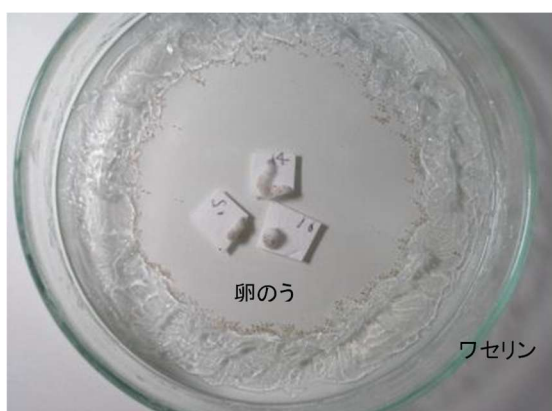
図2 1齢幼虫発生状況の確認