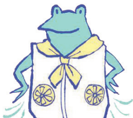
ファン付きウェア、 ネッククーラー