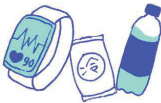
ウェアラブル端末、 応急セット