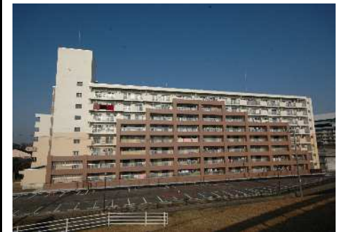
公営住宅等ストック総合改善事業 整備イメージ(耐震改修)