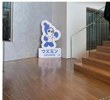
例：マスコットパネル