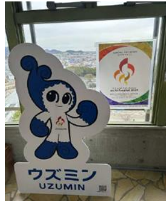
例：マスコットパネル