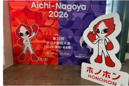
例：バックパネル及びマスコットパネル