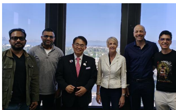
バークレー・スカイデックのスタートアップのみなさんと