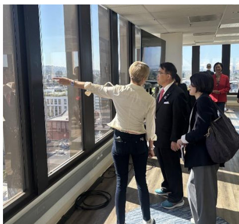
施設内視察の様子