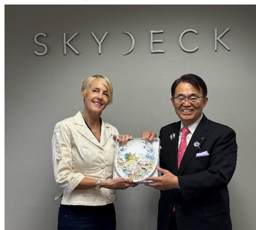
ウィンネット代表との記念品交換