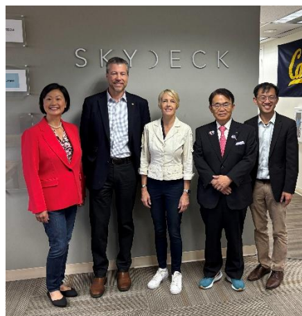
出席者の皆さんとの記念撮影