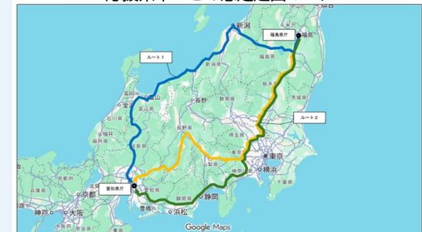
○福島県 <応援県市ごとの想定進出ルート>