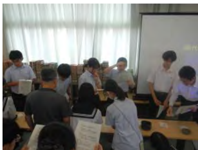
ワークショップ風景