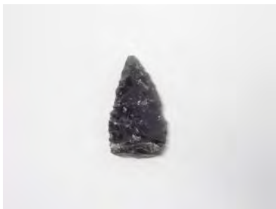
大人気だった黒曜石

主に縄文時代から古墳時代にかけての遺物を持参しましたが、黒曜石と埴輪は特に人気でした。埴輪の人気は予想していましたが、黒曜石は想定外でした。理由を聞いてみると、キラキラしているから、ゲームでよく知っているからといった回答が返ってきました。黒曜石をきっかけに考古学にも興味を持ってほしいと思い、黒曜石がどのような石か、出土した黒曜石からなにがわかるのかをお伝えしました。