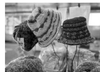
〔障害福祉サービス事業所で生産された商品（例）〕

障害者の工賃等の向上や雇用促進のため、企業と就労継続支援事業所等のマッチングや企業と芸術的な才能のある障害者のマッチングを行います。