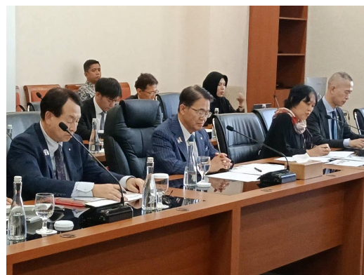
ファイソル工業副大臣との面談の様子②