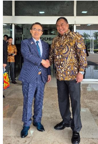
ゴーベル会長との記念撮影