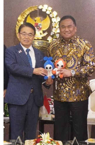
ゴーベル会長とアジア・アジアパラ 競技大会公式マスコット「ホノホン・ ウズミン」