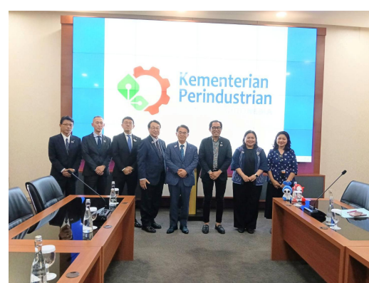
面談出席者との記念撮影