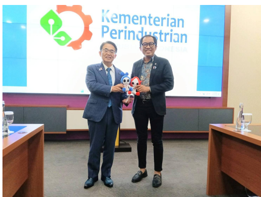
ファイソル工業副大臣との記念撮影