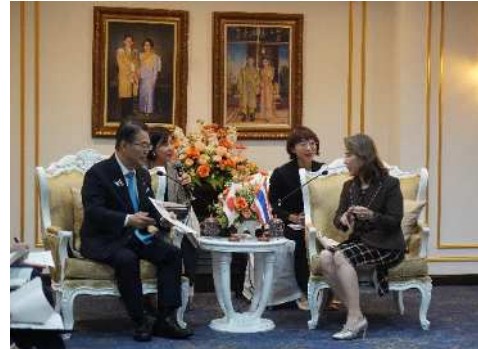
ラートラック副事務次官との面談の様子