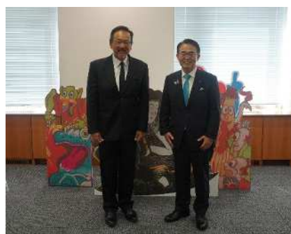
大鷹大使との記念撮影