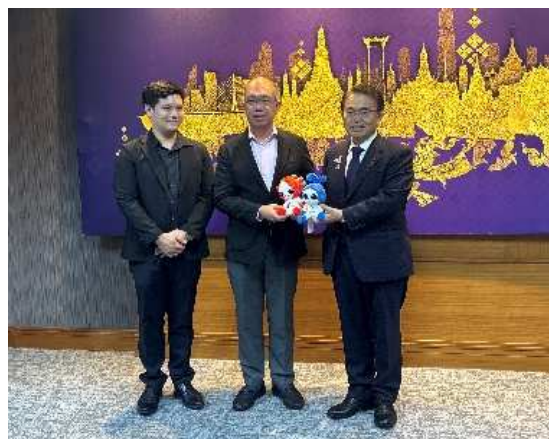
大村知事からタマヌーン営業統括責任者へ アジア・アジアパラ大会マスコット 「ホノホン・ウズミン」を贈呈