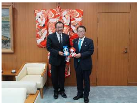
大鷹大使とアジア・アジアパラ 競技大会公式マスコット 「ホノホン・ウズミン」

また、今年9月から10月にかけて愛知県で開催される第20回アジア競技大会、第5回アジアパラ競技大会や、2027年に開催される第60回アジア開発銀行年次総会等について紹介し、幅広く意見交換を行いました。