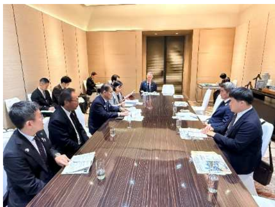
パサコン副事務次官との面談の様子①

これに対して大村知事は、「AXIA EXPOの内容は8月に決まるため、固まり次第連絡させていただく。今後も愛知県とタイのつながりをより一層深め、日本とタイの関係強化に貢献してまいりたい。貴職にも引き続きお力添えを賜りたい。近いうち、是非愛知県を訪問してほしい。」と述べ、面談を締めくくりました。