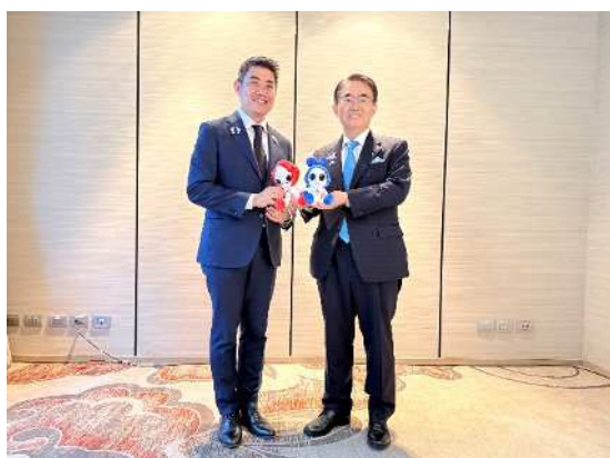
パサコン副事務次官との記念撮影