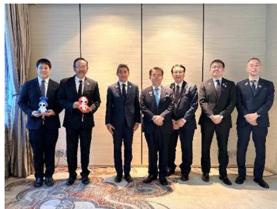
面談出席者との記念撮影