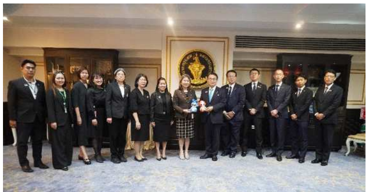
面談出席者との記念撮影