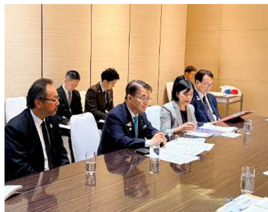
パサコン副事務次官との面談の様子②