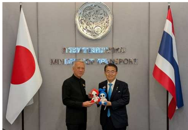
ピパット副首相兼運輸大臣との記念撮影