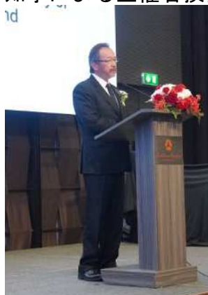
大鷹駐タイ日本国大使による来賓挨拶