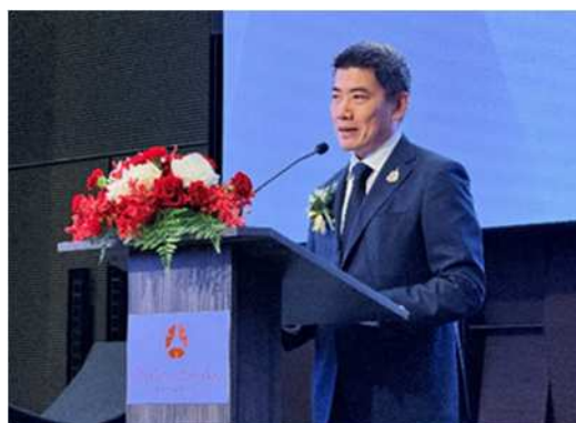
パサコン副事務次官による来賓挨拶