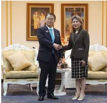
ラートラック副事務次官との冒頭挨拶

これに対してラートラック副事務次官は、「愛知県との交流について、これまでの青少年交流等に加えて、これまでよりも拡大できることを祈っている」と応じ、今後も両地域の発展に向けて協力していくことを確認しました。