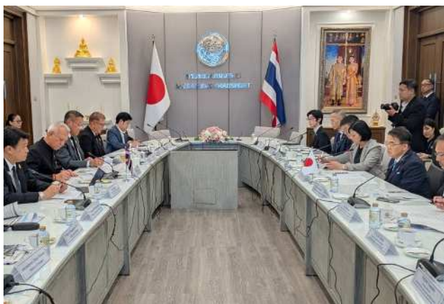
ピパット副首相兼運輸大臣との 面談の様子