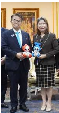
ラートラック副事務次官と アジア・アジアパラ競技大会 公式マスコット「ホノホン・ウズミン」