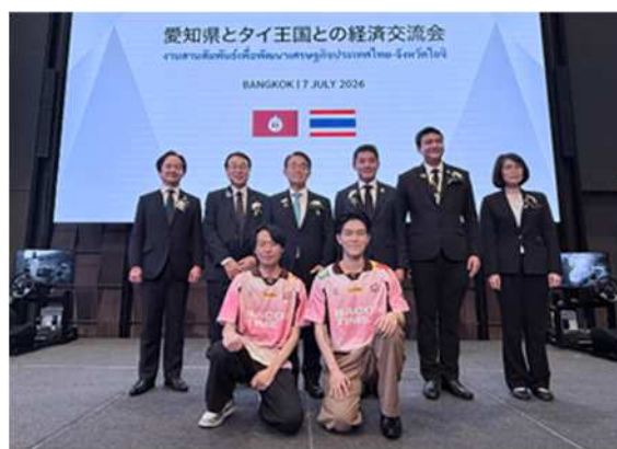
タイ人 e スポーツプレイヤーとの記念撮影