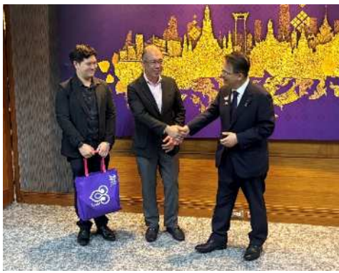
握手を交わす大村知事と タマヌーン営業統括責任者