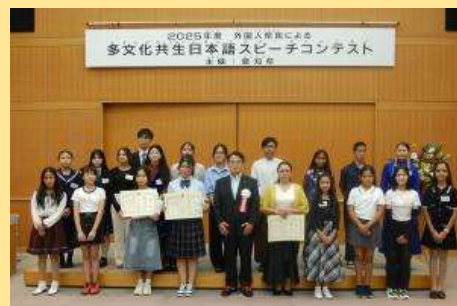
さくねんど しゅつじょうしゃ みなさま ひょうしゅうしき 昨年度の出場者の皆様の表彰式

さくねんど ようす 昨年度の様子は Youtube チャ ンネルで配信しています。