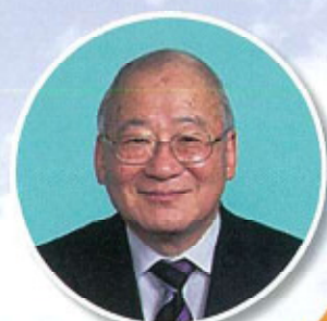
秋草学園短期大学学長 北野 大

地球温暖化、自然環境の保全、生物多様性、環境活動など幅広く環境について、講義やワークショップなどを通じて学びます。