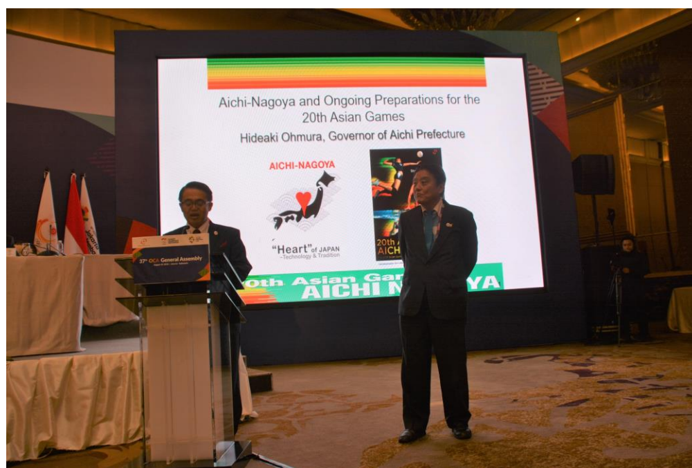
大村愛知県知事と河村名古屋市長によるプレゼンテーションの開始前