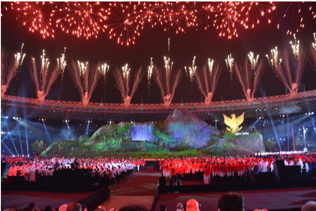
第 18 回アジア競技大会開会式の様子