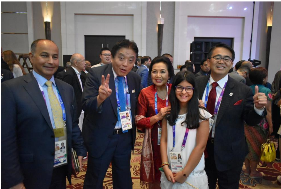
リタ・スボウォ OCA 副会長 (元インドネシアオリンピック委員会委員長) と (左から フセイン OCA 事務総長、河村名古屋市長、 リタ・スボウォ OCA 副会長、大村愛知県知事)