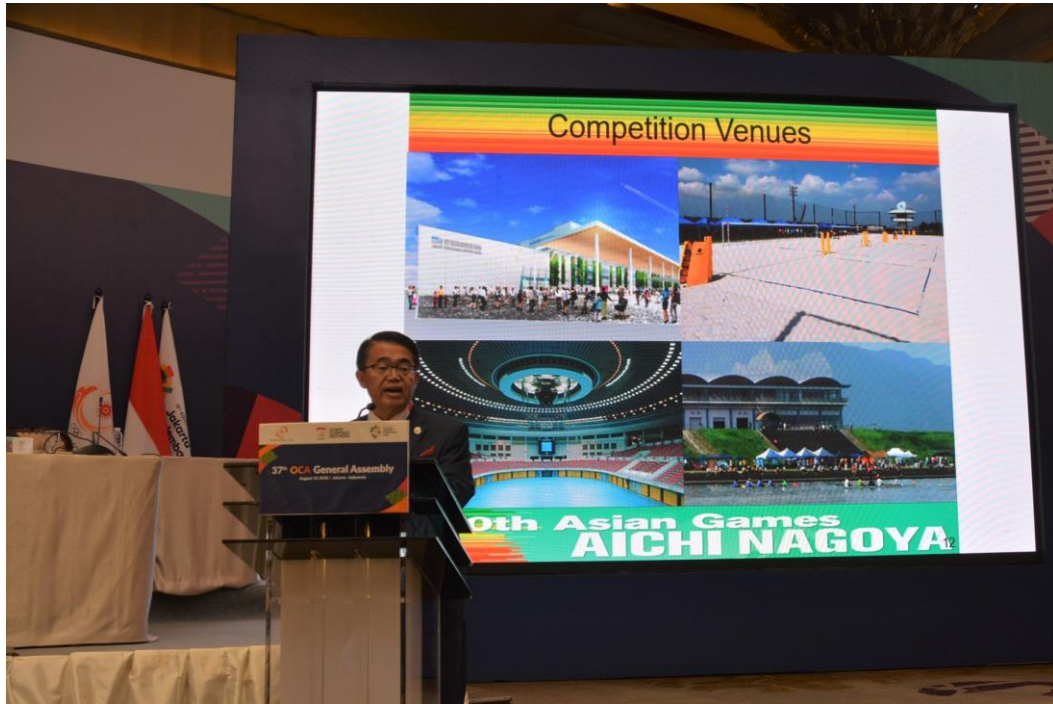
大村愛知県知事によるプレゼンテーション