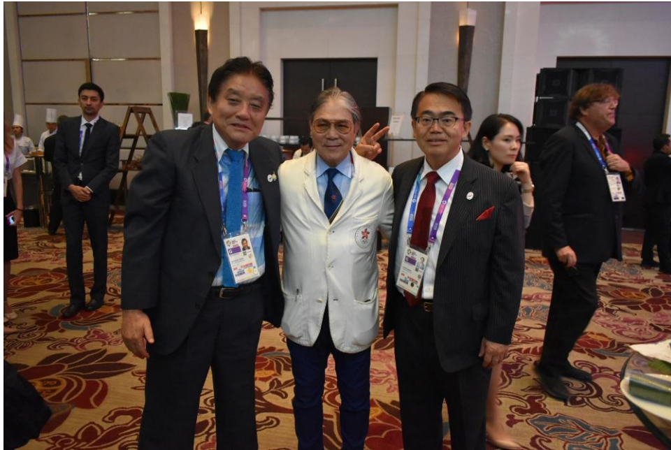
フォック OCA 副会長と (左から 河村名古屋市長、フォック OCA 副会長、大村愛知県知事)