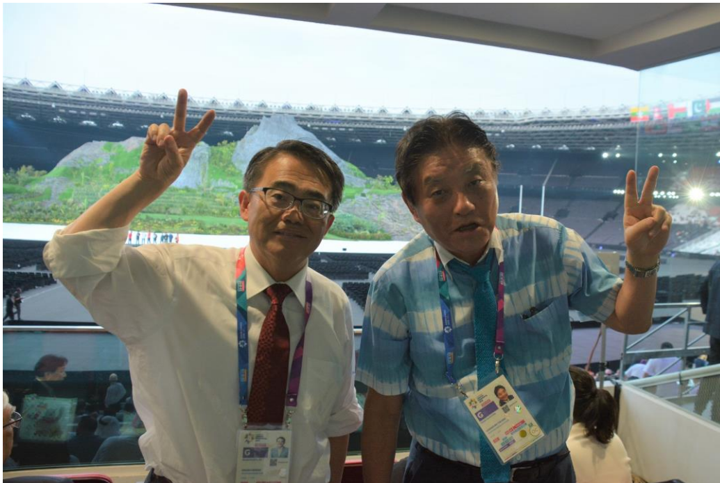
第 18 回アジア競技大会（2018/ジャカルタ・パレンバン）開会式の観覧席にて