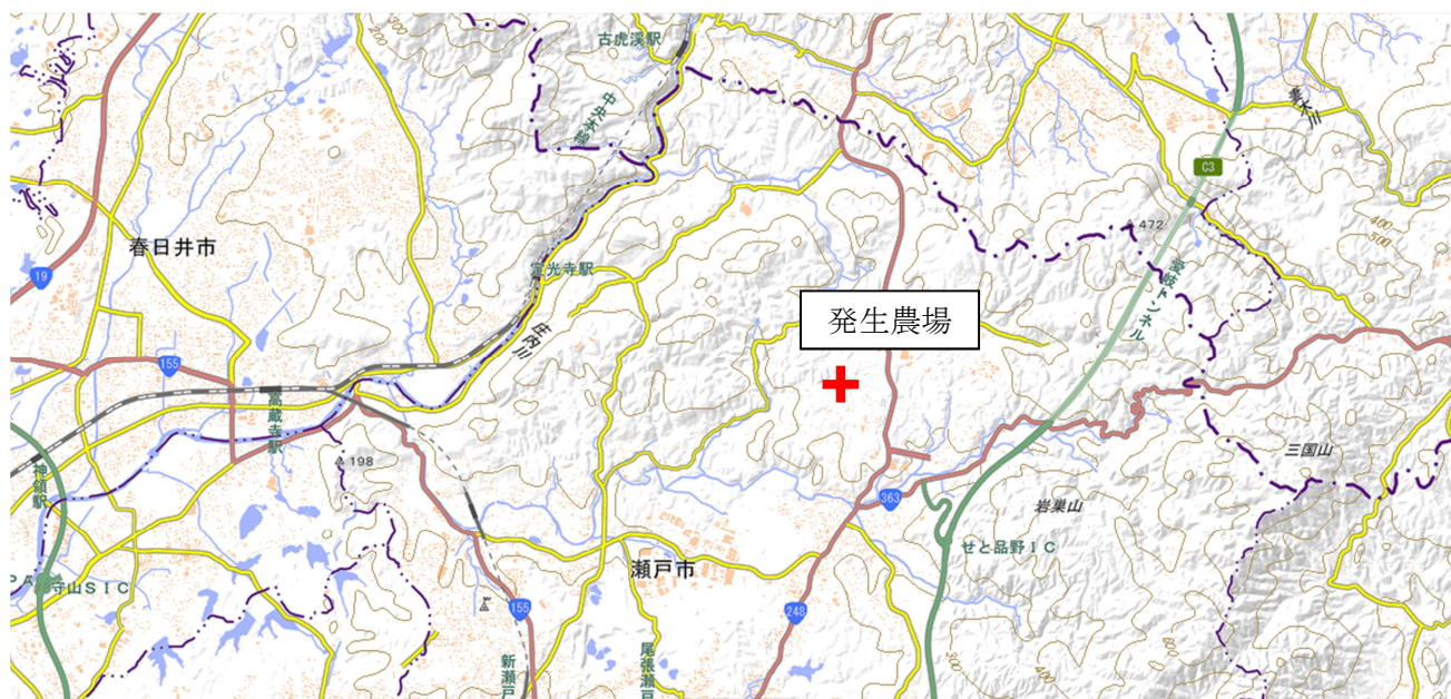
【発生農場の位置関係図】