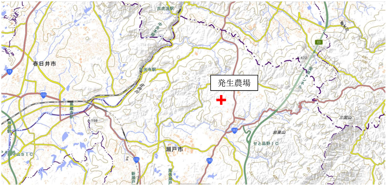
【発生農場の位置関係図】