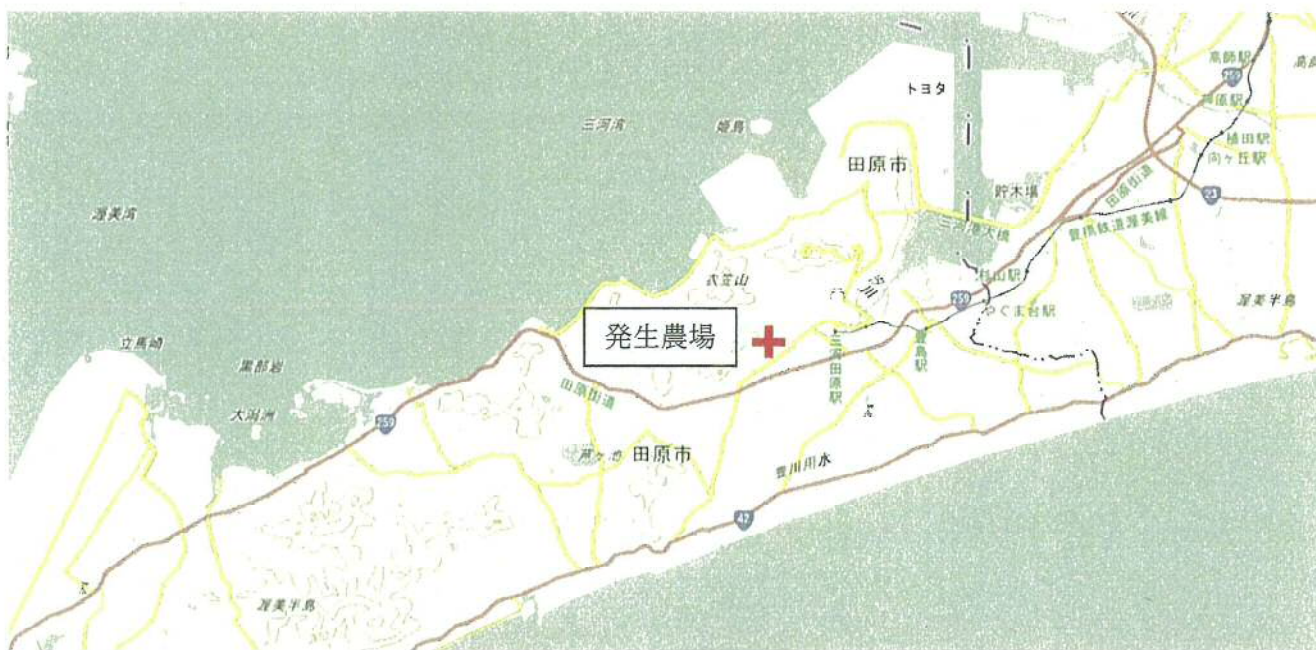
【発生農場の位置関係図】