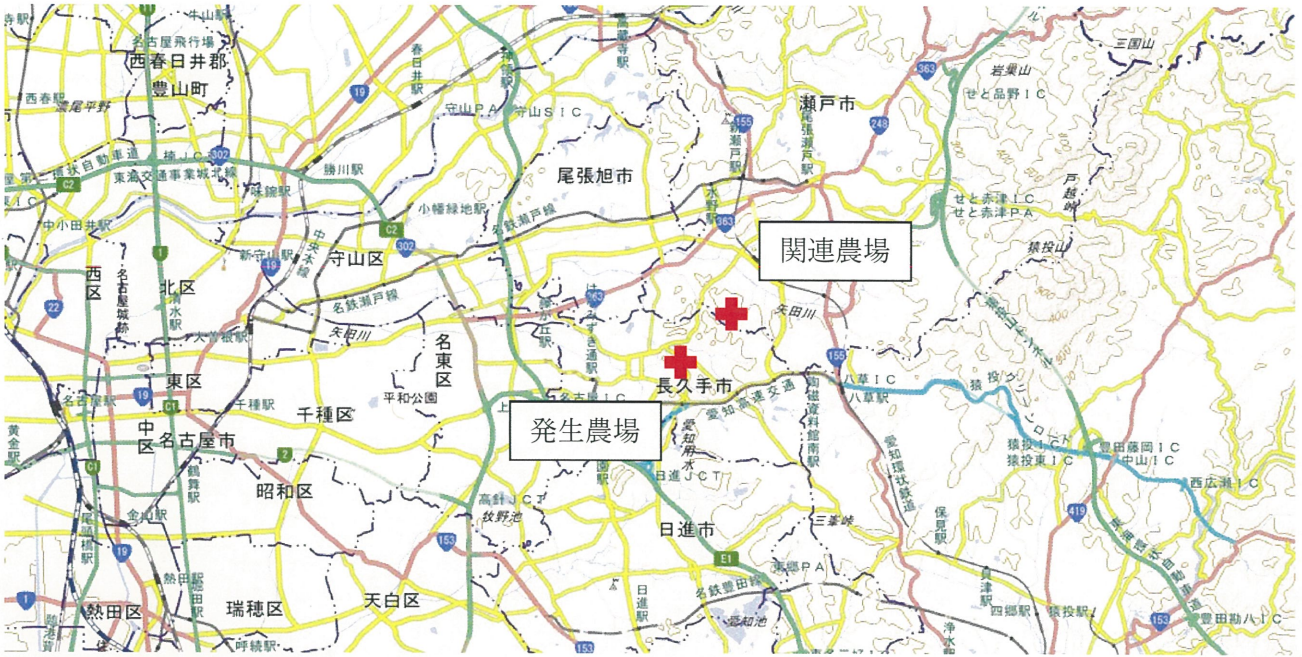
【発生農場及び関連農場の位置関係図】