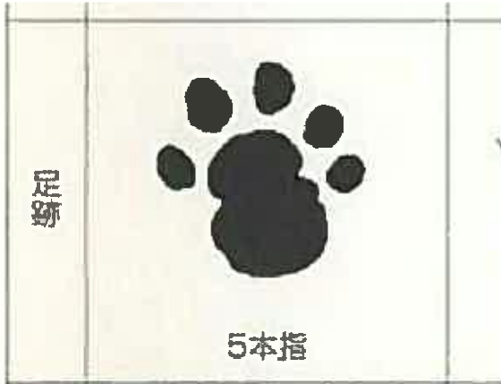
ハクビシンの足跡