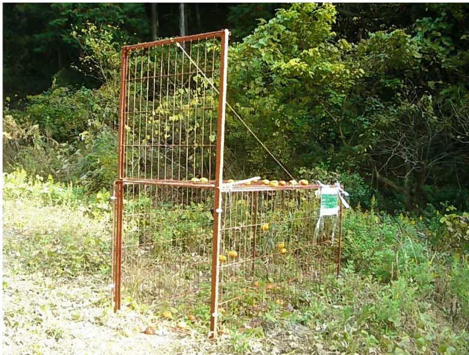
サル檻 ぶら下げた柿を引っ張るとスイッチが入るようにする