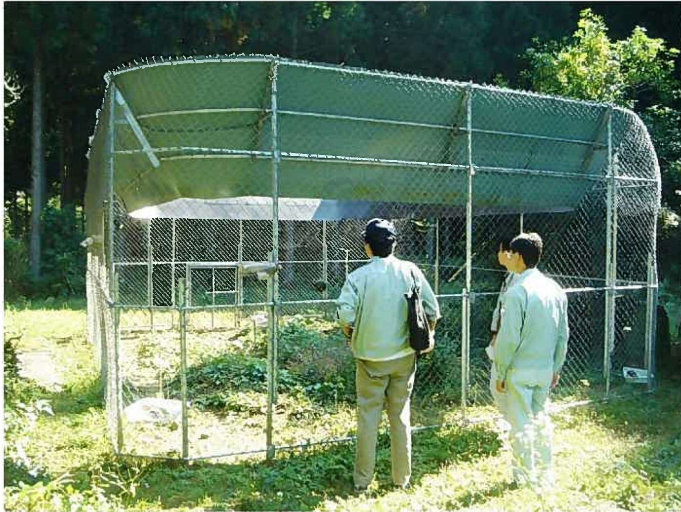
トバリ式 巨大ロート