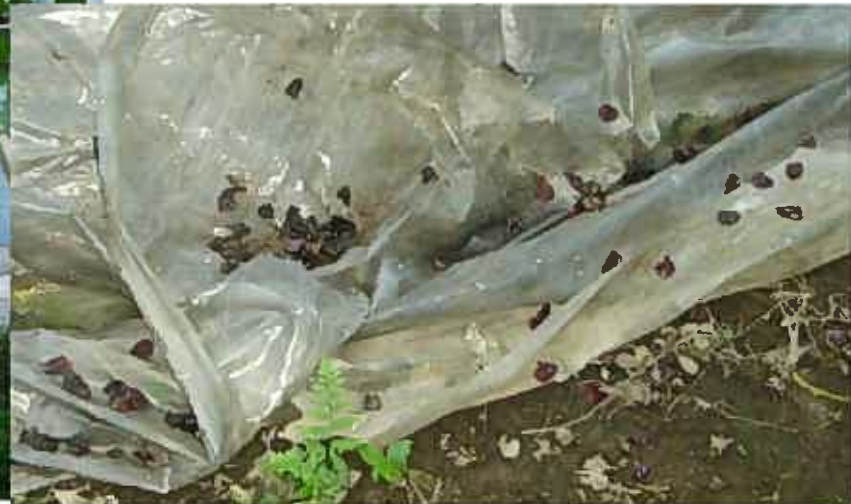
皮が下に落ちている