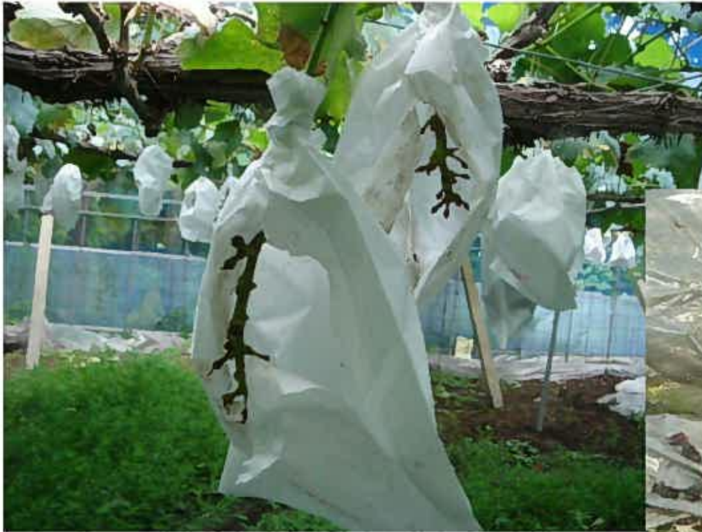
ハクビシンに食べられたブドウ