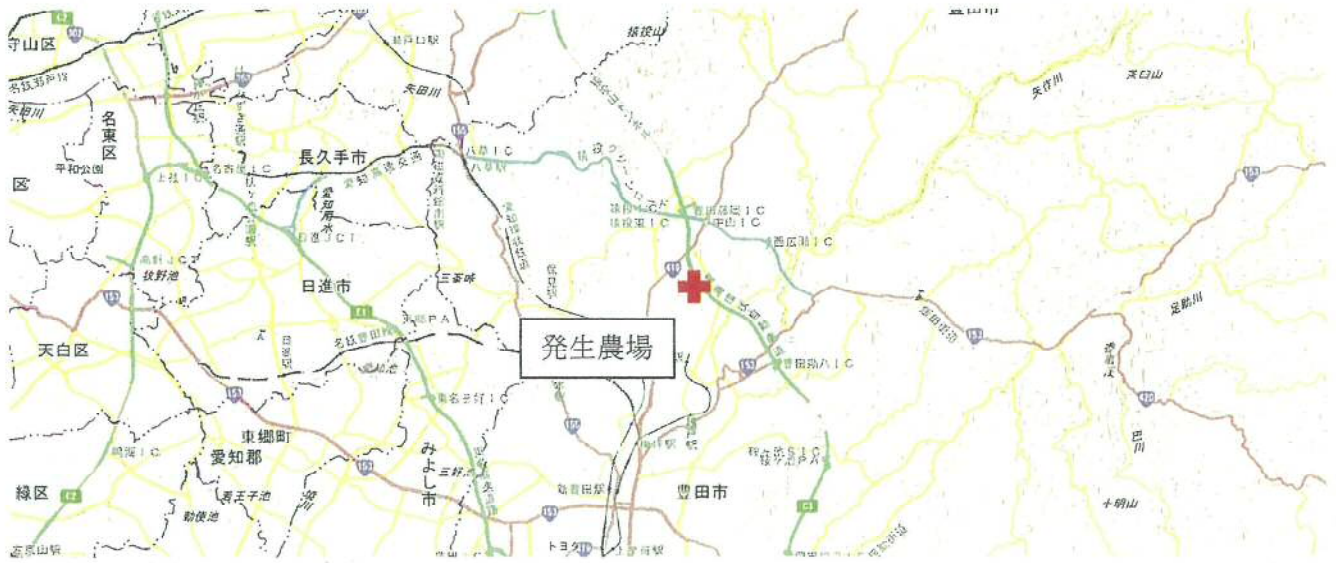
【発生農場の位置関係図】