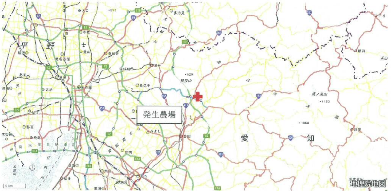
【発生農場の位置関係図】