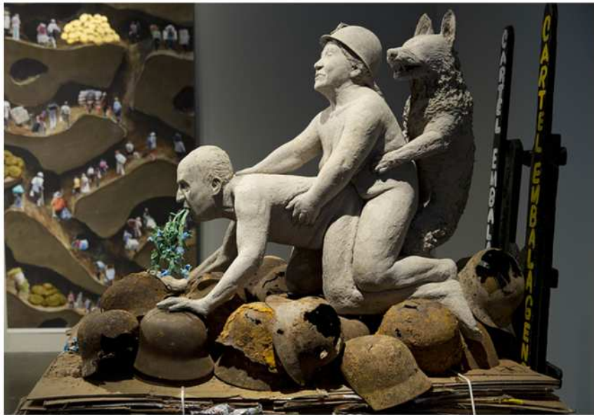
Ines Doujak – Not Dressed for Conquering (2015)