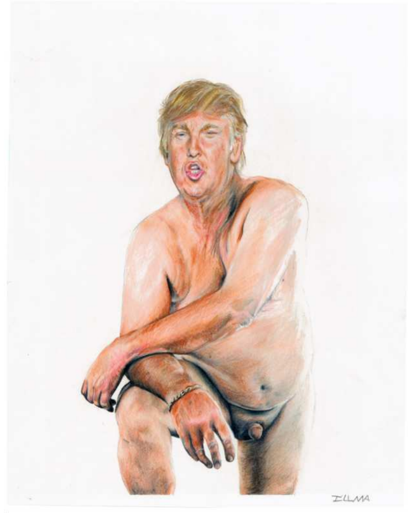
Illma Gore – Make America Great Again (2016)