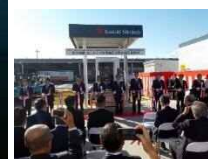
セントレア貨物地区水素充填所(2018.11開所)