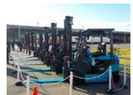
中部スカイサポート(株) ANA中部空港(株)