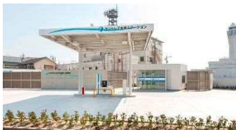
セントレア水素ステーション (2019.3 開所)