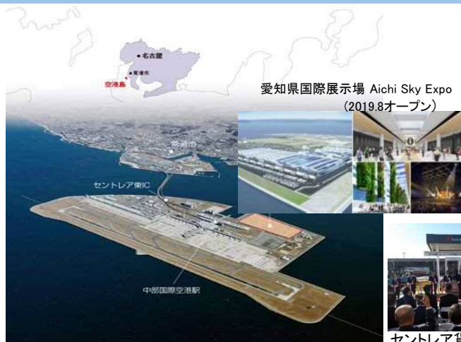
愛知県国際展示場 Aichi Sky Expo (2019.8オープン)