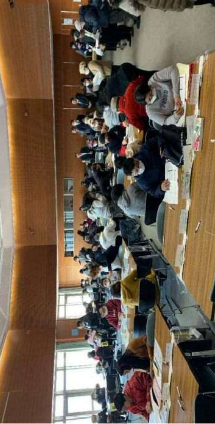
令和2年2月2日(日)税務相談会の様子

確定申告の時期にあわせて、通訳を配置した外国人向けの税務相談会を開催し、複雑な税務手続きや、税金全般についての相談業務を行う。