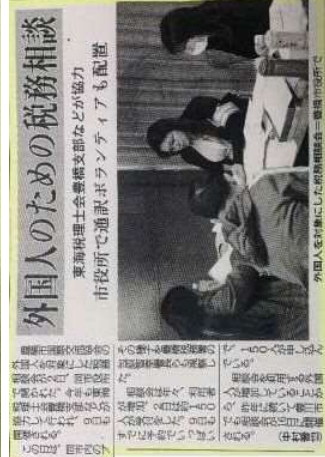
外国人を支援した市役所職員(豊橋市役所で)