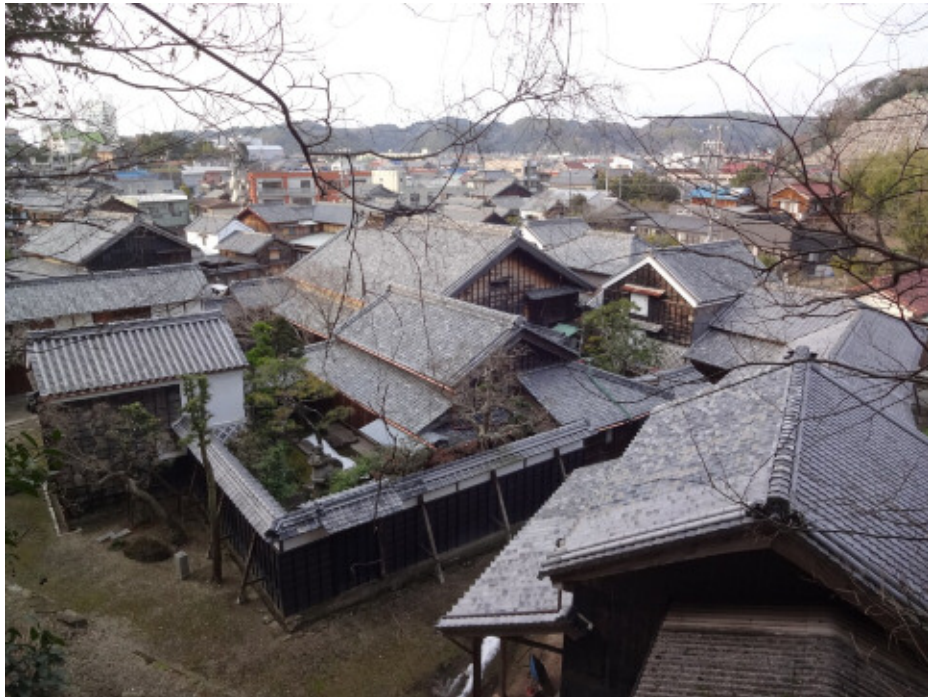
旧内田家住宅 建物外観