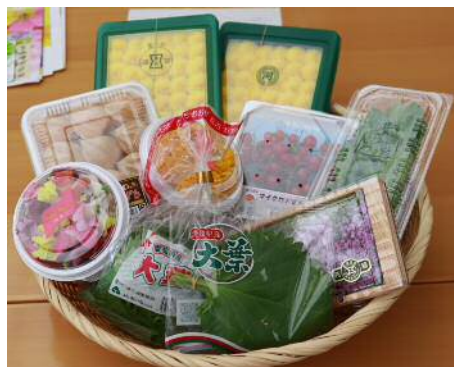
あいちの特産「つまもの」