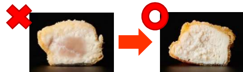
鶏の唐揚げを調理した時の画像