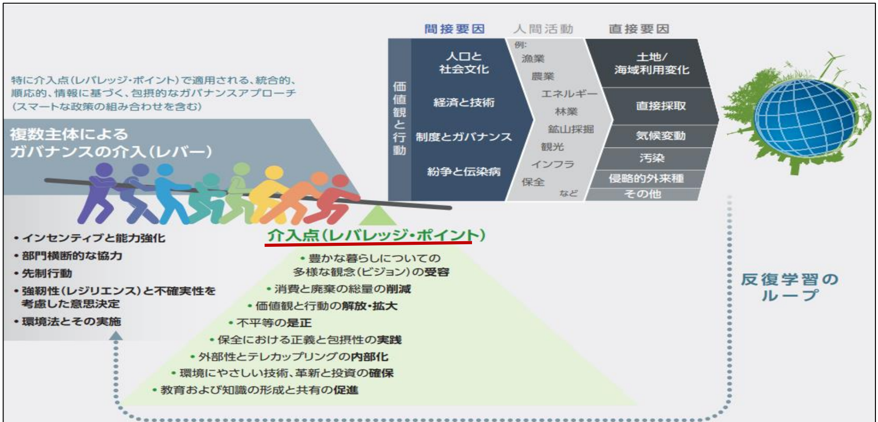
図 SPM. 9 地球の持続可能性の実現に向けた社会変革。

C. 自然の保全と持続可能な利用、および持続可能な社会の実現に向けた目標は、このままでは達成できない。2030年以降の目標の達成に向けて、経済、社会、政治、技術すべてにおいて 変革 (transformative change) が求められる。