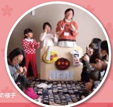
みらいJr.の活動の様子