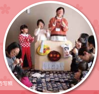
みらいJr.开展活动的写照