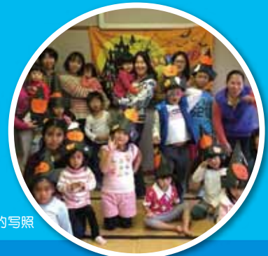
みらいJr.开展活动的写照