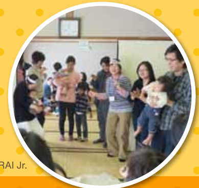
Aspecto da atividade de MiRAI Jr.

Quando o filho fica doente é preocupante, não é? Vamos aprender o que podemos fazer em casa e como se faz para usar o hospital.