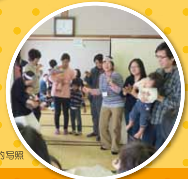
みらいJr.开展活动的写照