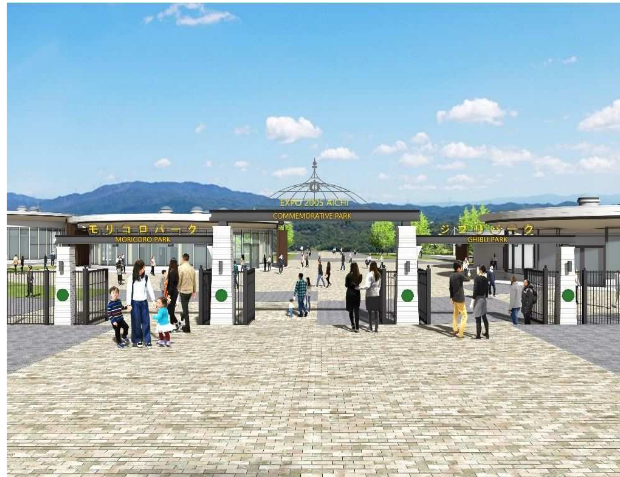
A メインゲート整備イメージ（北側から臨む）