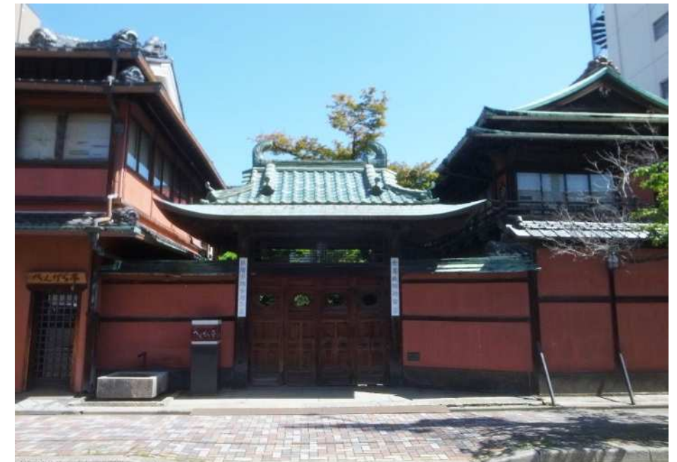
解体前の料亭「稲本」の楼門