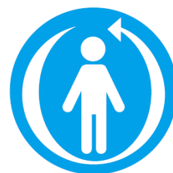
Apoio contínuo de acordo com o ciclo de vida

👉 Objetivamos a “Continuação de apoios”.