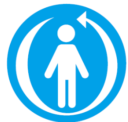
Patuloy na Suportang Tumutugon sa Siklo ng Buhay

👉 Nilalayan ang 'Pagkakaugnay ng Suporta'.