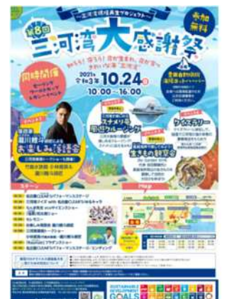
2021年度三河湾大感謝祭