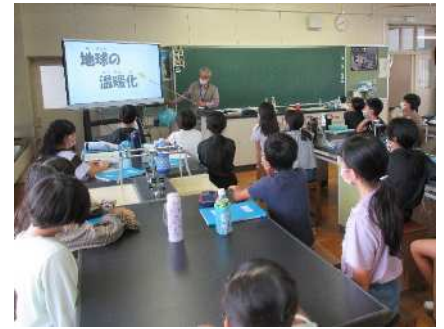
環境学習の様子（日進市立東小学校）