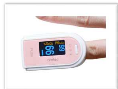
Oxímetro de pulso (valores normais: 95% ou acima)

* Saturação de oxigênio: é uma medição se os pulmões estão funcionando corretamente e se oxigênio está sendo fornecido o suficiente para o sangue. O Centro de Acompanhamento de Saúde de Aichi lhe emprestará um aparelho (oxímetro de pulso) para a sua medição. Ao terminar o período de recuperação em casa, deve devolver o aparelho colocando-o no envelope-resposta.