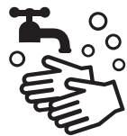
石けんによる手洗い