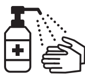
手指消毒用アルコールによる消毒の励行