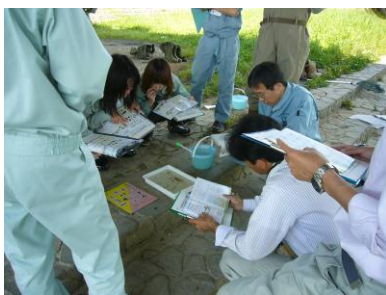
流域モニタリング一斉調査体験会の様子